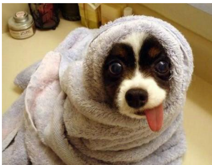
Musím to kafe omezit